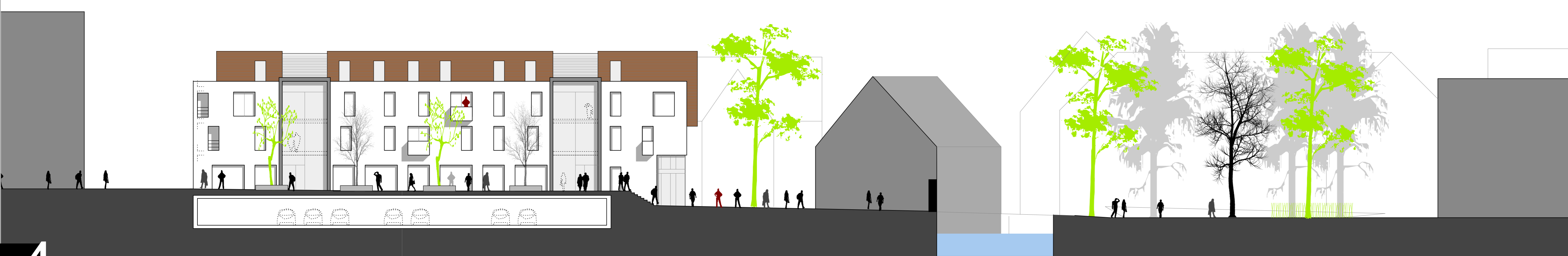
Schnitt 2-2 / Nordansicht südliches Gebäude: Wohn- und Geschäftshaus