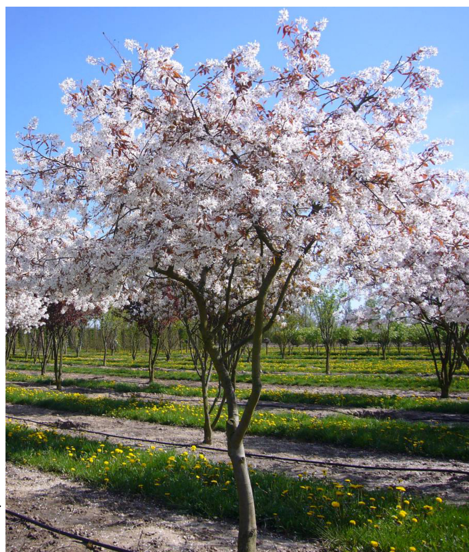
Amelanchier blühen im Frühjahr