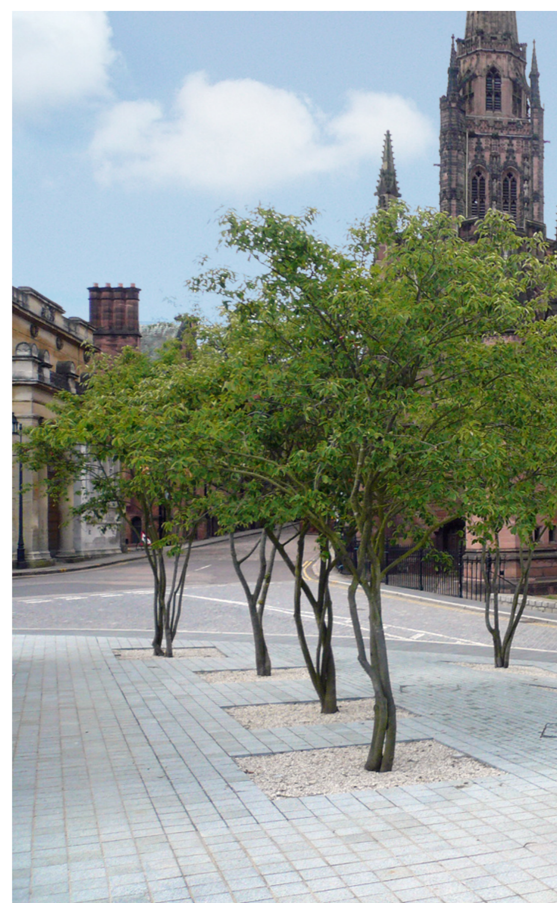
Amelanchier im Sommer

DELTA BAU AG Hohenzollernstr. 27 30161 Hannover Telefon (0511) 2 80 06-0 Fax (0511) 2 80 06-33