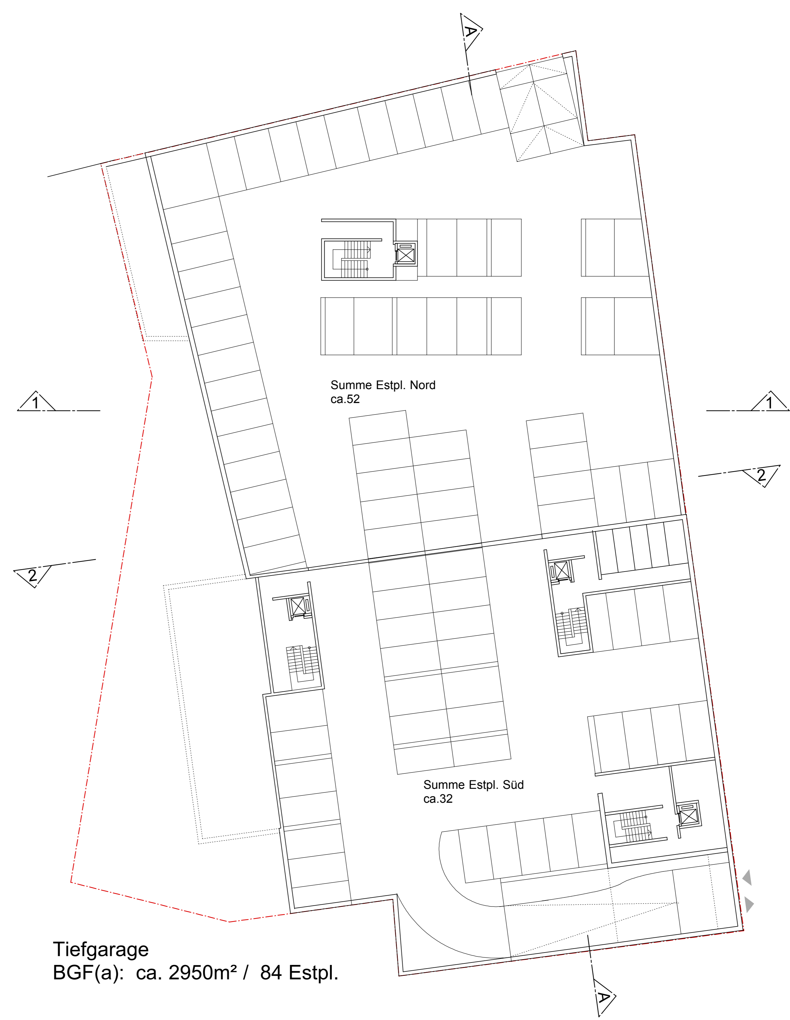
Tiefgarage BGF(a): ca. 2950m 2 / 84 Estpl.