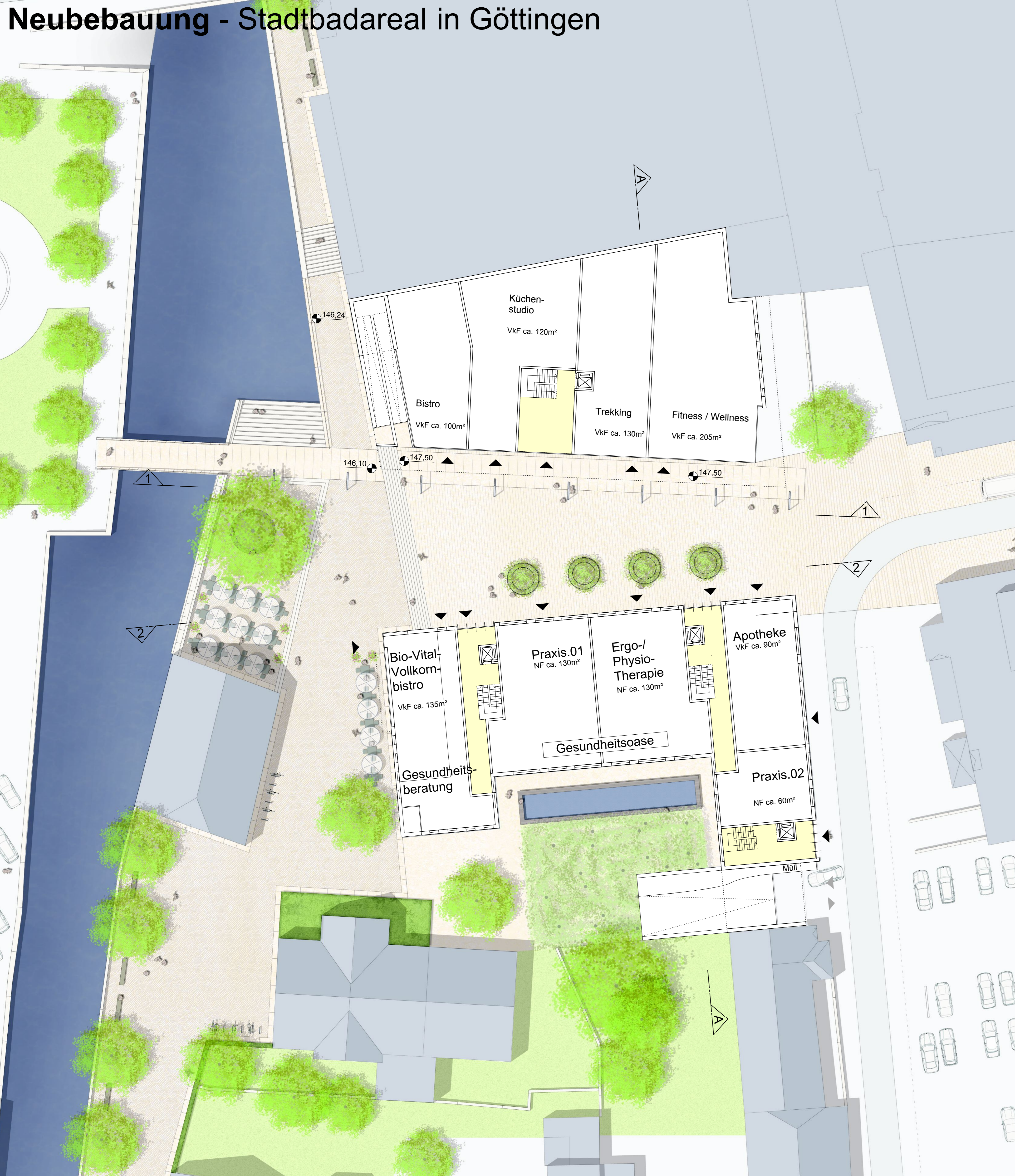
Wohngebäude und Geschäftsgebäude Erdgeschoss