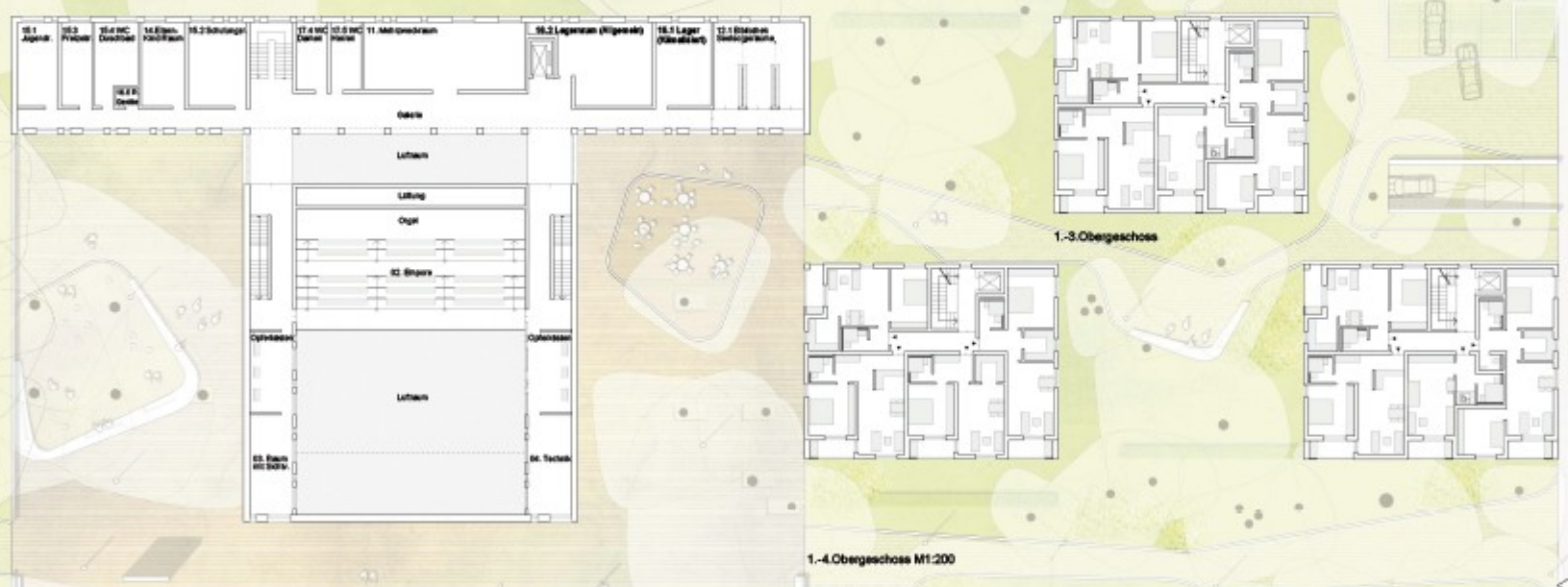
1. Obergeschoss M1:200